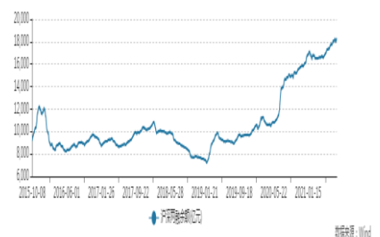
图 2. 沪深两市融资余额变化