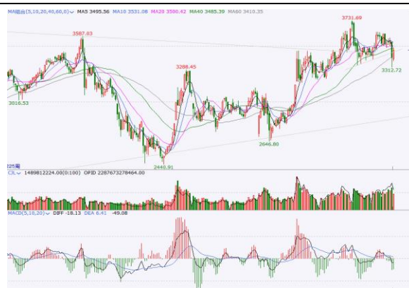
图 4.上证指数周 K 线图