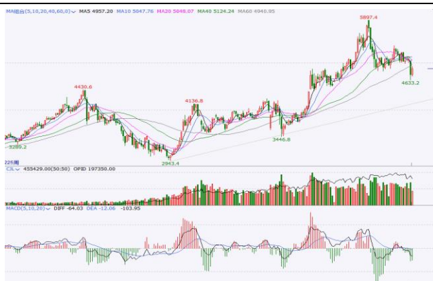
图 3.IF 加权周 K 线图

周线方面，IF 加权跌破 4 月低点 4826 及 60 周线，10 周线下穿 20 周线，技术上进入空头趋势，短期关注前期低点 4633 一线支撑，若被有效跌破，需防范继续探底风险。