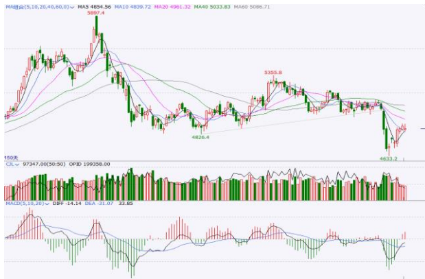
图 5. IF 加权日 K 线图

日线方面，IF 加权跌破前期低点 4826 与 4878 连线支撑，均线簇空头排列、向下发散，形成日线级别的下跌趋势。股指快速下跌后，短期或进入反复震荡筑底阶段。