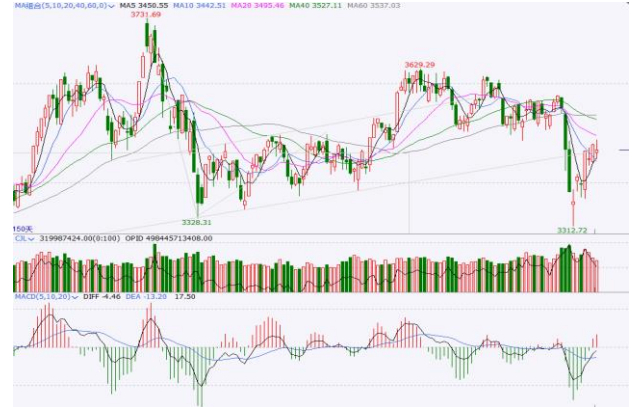
图 6. 上证指数日 K 线图