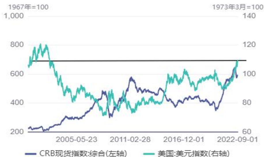
图 4. 美元指数逼近 110 关口挺近逾 20 年历史高位施压商品