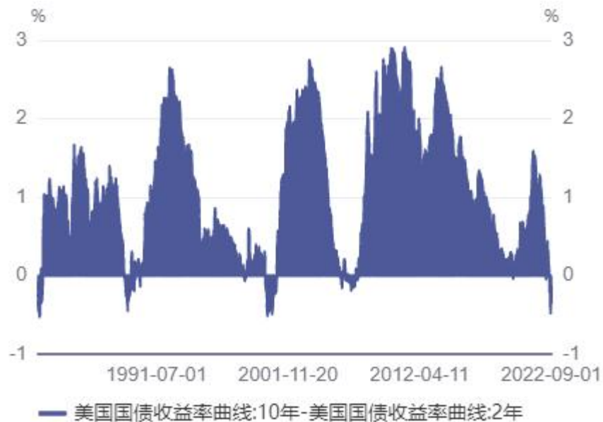
图2. 美国10年期国债收益和2年期国债收益率倒挂幅度逾20年以来最大

美国长短期国债收益率曲线倒挂幅度逾20年最大，美国经济陷入远期衰退的阴霾，可能笼罩在美国升息的后半场之中，“放缓加息-降息”的交易预期落空，超预期金融环境收紧的背景下，大宗商品仍在熊市波动框架之中。