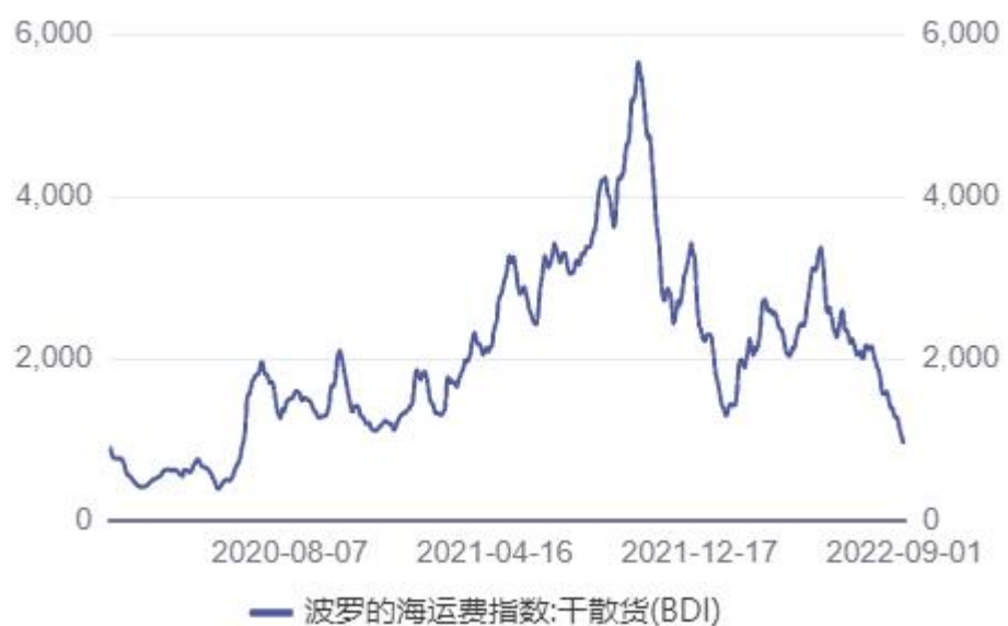
图1. BDI指数疫情危机以来牛熊波动

2022年7月到8月间，BDI指数陡峭下跌-55.9%至965点，显示全球经济景气度低迷，大宗商品原料需求不足。