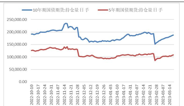
图 3 两大期债持仓量变化