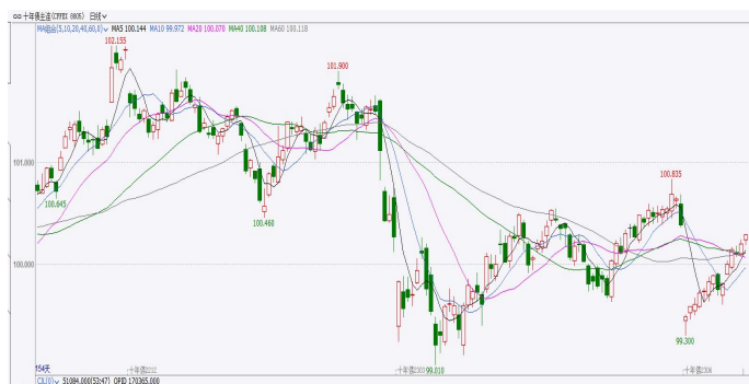
图 2.国债期货 10 年期日 K 线图

本周，国债期货重心上移。欧美银行危机由美国蔓延至欧洲，全球避险情绪升温。另外，MLF 超额平价续作，降准预期落空，国内金融数据和经济数据企稳回升对债市带来的利空影响较弱。全周来看，10 年期主力合约涨 0.17%，5 年期主力合约涨 0.13%，2 年期主力合约涨 0.08%。周一国债期货多数小幅收跌，10 年期主力合约跌 0.05%，5 年期主力合约跌 0.02%，2 年期主力合约收平；周二国债期货全线收涨，10 年期主力合约涨 0.14%，5 年期主力合约涨 0.08%，2 年期主力合约涨 0.02%；周三国债期货小幅收跌，10 年期主力合约跌 0.07%，5 年期主力合约跌 0.06%，2 年期主力合约跌 0.01%；周四国债期货全线收涨，10 年期主力合约涨 0.22%，5 年期主力合约涨 0.14%，2 年期主力合约涨 0.05%；周五国债期货窄幅震荡收盘涨跌不一，10 年期主力合约跌 0.01%，5 年期主力合约涨 0.01%，2 年期主力合约接近收平。