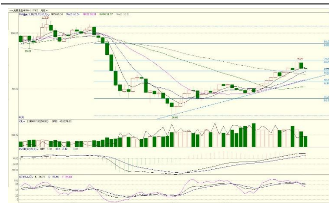
图 3. WTI 主力日 K 线图