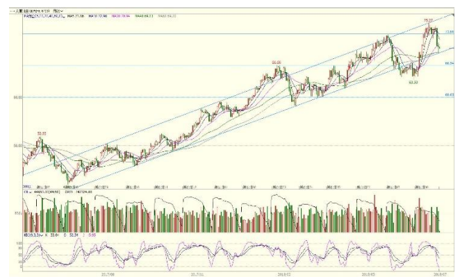
图 3. WTI 主力日 K 线图