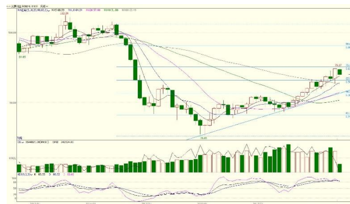
图 2.WTI 主力月 K 线图