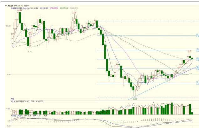
图 3. WTI 主力日 K 线图