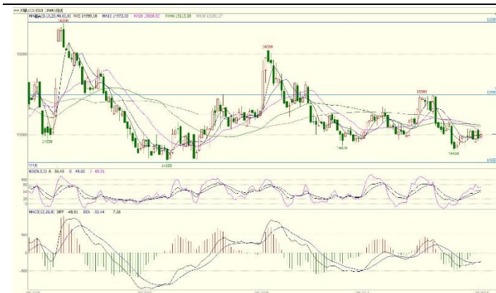
图 2. CF1801 日线图

从美棉指数日 K 线图上看, 本周期价再度走强, 但 MACD 指标高位出现背离, 短线 80 美分附近料有较强压力。