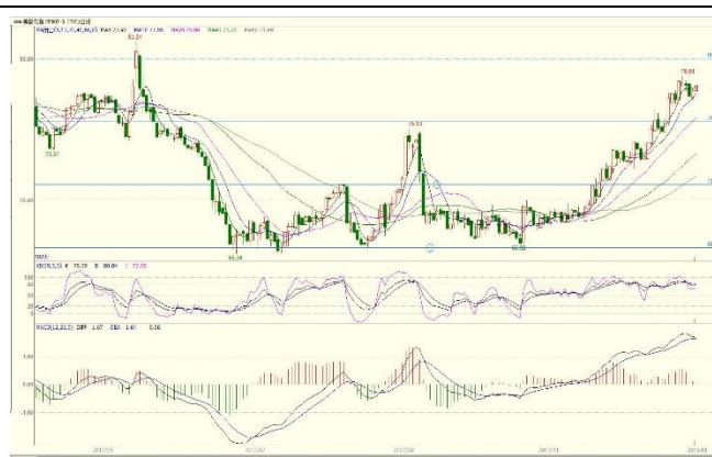
图 3. ICE 期棉指数日线图