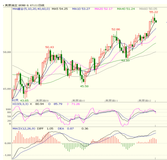
图 1 美原油主力合约

本周 API 公布数据显示，截至 10 月 27 日当周，美国原油库存减少 509 万桶，至 4.568 亿桶，分析师预计为减少 180 万桶。库欣原油库存下降 26.3 万桶。上周汽油库存减少 769.7 万桶，分析师预计减少 150 万桶。同时上周精炼油库存减少 310.6 万桶，分析师预估减少 210 万桶。美国上周原油日进口量减少 39.6 万桶/日，至 700 万桶/日。石油输出国组织（OPEC）海湾成员国代表本周表示，该组织很有可能会将减产协议延长至 2018 年底，尽管明年存在供应受阻的潜在风险。OPEC 下次政策会议将于 11 月 30 日在维也纳总部举行。预计美原油短线运行区间 53.0-56.5。