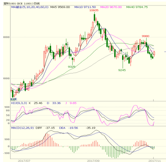
图 3 LLDPE1801 合约日线图