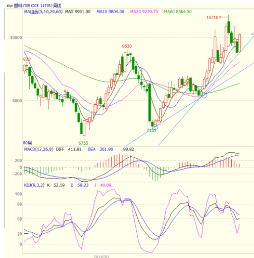
图 3 LLDPE1705 合约周线图