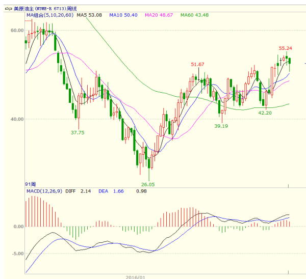
图 1 美原油主力合约周线图

下降 57.9 万桶，降幅创 2016 年 10 月 21 日当周以来最大。美国油服贝克休斯公布的数据显示 1 月 13 日当周美国石油活跃钻井数减少 7 座至 522 座，为 12 周来首降，同时也是七个月来第二周录得减少。本周原油走低，至收盘美原油周 K 线下跌 2.20%，收出带长下影的小阴线，下方 10 周均线支撑较强。