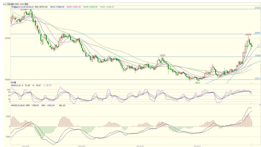
图 3 沪胶指数周线图