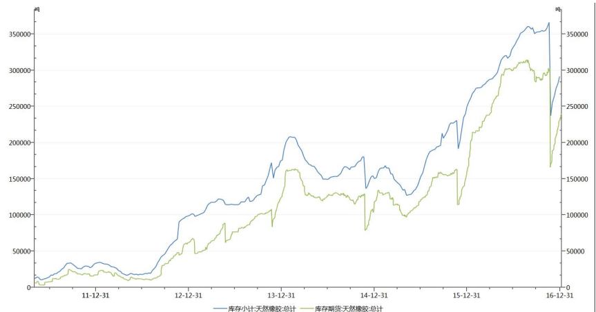
图 2 上期所天胶期货库存