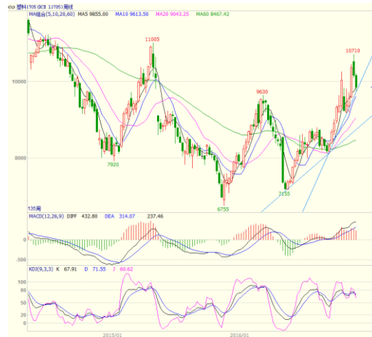
图 3 LLDPE1705 合约周线图