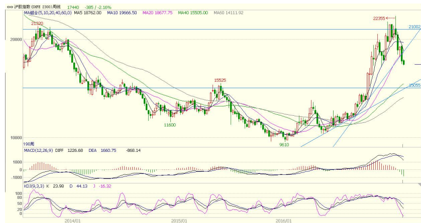
图 3 沪胶指数周线图