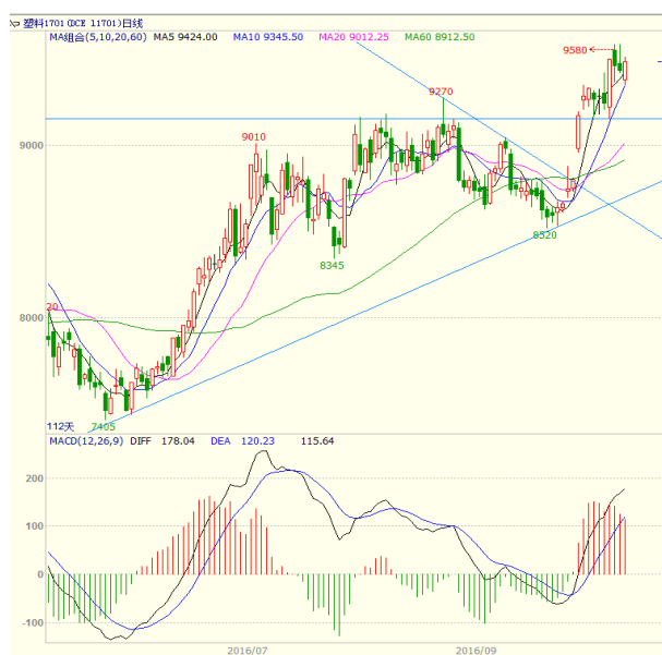
图 3 LLDPE1701 合约日线图

1701 合约本周震荡走高，收出中阳线，周线收盘价创出 7 月以来新高。周一收出带长上影小线、周二收出大阳线、周三高开低走收出中阴线，周四冲高回落收出带长上影的小阴线，周五低开高走收出中阳线。最终周线带长下影的中阳线。均线方面，下方 5、10 日均线形成支撑，周线上，5 周均线继续向上，且 5 周均线上穿 10 周均线，支撑较强。