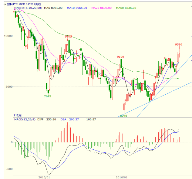
图 4 LLDPE1701 合约周线图