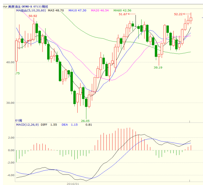
图1 美原油主力合约周线图

本周美国能源信息署(EIA)公布的数据显示,截至10月14日当周,美国EIA原油库存下降520万桶,4.687亿桶;库欣地区原油库存5969.9万桶,减少了163.5万桶;美国成品油需求总量平均每天2006万桶,比去年同期高3.6%。美国油服贝克休斯公布的数据显示,截至2016年10月21日当周美国石油活跃钻井数增加11座至443座,为连续第8周增加,且已经连续17周末录得减少。至收盘美原油周K线收盘上涨1.35%,收出小阳线,下方5、10日均线形成支撑,短线震荡偏强走势。