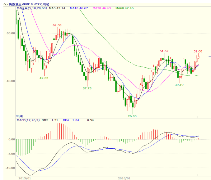
图 1 美原油主力合约周线图

当周，美国 EIA 原油库存增加 485 万桶，为六周里首度增加，并创下 6 个月最大增幅。但汽油库存和精炼油库存降幅均超出预期。库欣地区库存下降 132 万桶，预期为增加 40 万桶。美国油服贝克休斯公布的数据显示，截至 2016 年 10 月 14 日当周美国石油活跃钻井数增加 4 座至 432 座，过去的 20 周时间里 18 周录得增加。至收盘美原油周 K 线收盘上涨 1.55%，收出小阴线，下方 5、10 日均线形成支撑，短线震荡偏强走势。