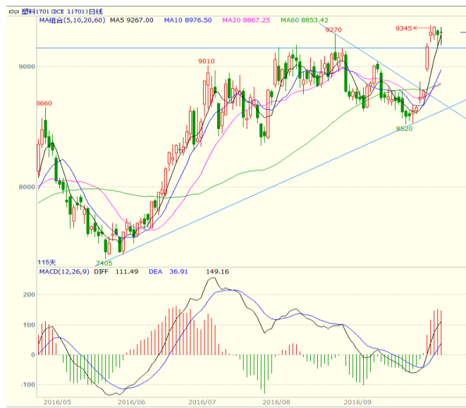
图 3 LLDPE1701 合约日线图

出实体较长的大阳线。均线方面，下方 5、10 日均线形成支撑，周线上，5 周均线拐头向上，目前 5 周均线在本周跳空缺口附近，支撑较强。