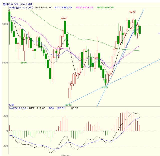
图 4 LLDPE1701 合约周线图