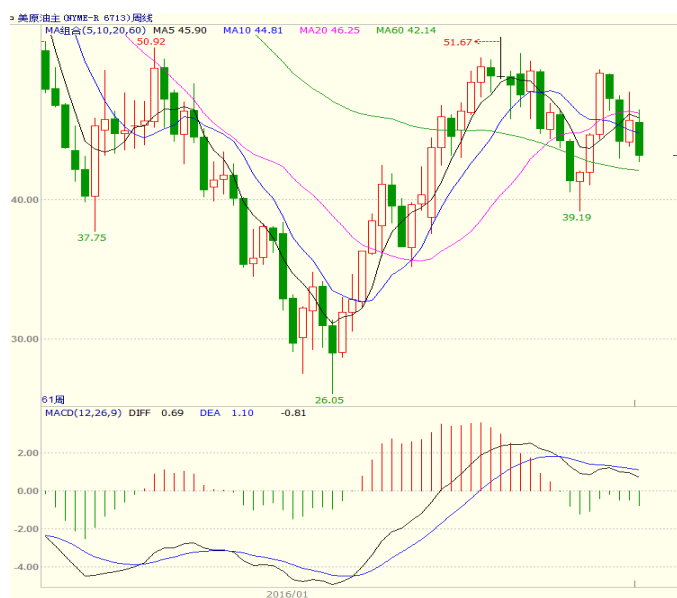
图1 美原油主力合约周线图

本周美国能源信息署(EIA)公布的数据显示,截至9月9日当周,美国EIA原油库存减少55.9万桶,至5.1080亿桶;美国汽油库存增加56.7万桶,至2.2836亿桶;备受市场关注的库欣地区原油库存减少124.5万桶,至6218.8万桶。美国油服贝克休斯公布的数据显示,截至2016年9月16日当周美国石油活跃钻井数增加2座至416座,过去12周内第11周录得增加。至收盘美原油周K线收盘下跌5.51%,收出中阴线,上方5、10日均线承压,短线走势震荡。