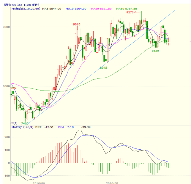
图 3 LLDPE1701 合约日线图

收出影线较短，实体较长的中阴线。均线方面，周一时大幅走低跌破 5、10 日均线，周三时 5 日均线拐头向下。周线上，5 周均线拐头向下，但 10、20 周均线继续走高，至收盘跌破 5、10 周均线。