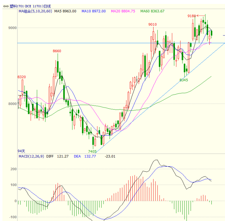
图3 LLDPE1701 合约日线图

线方面，价格跌破5、10日均线支撑，5日均线拐头向下，且向下穿越10日均线。周线上，5、10、20周均线继续走高，下方5周均线支撑较强。