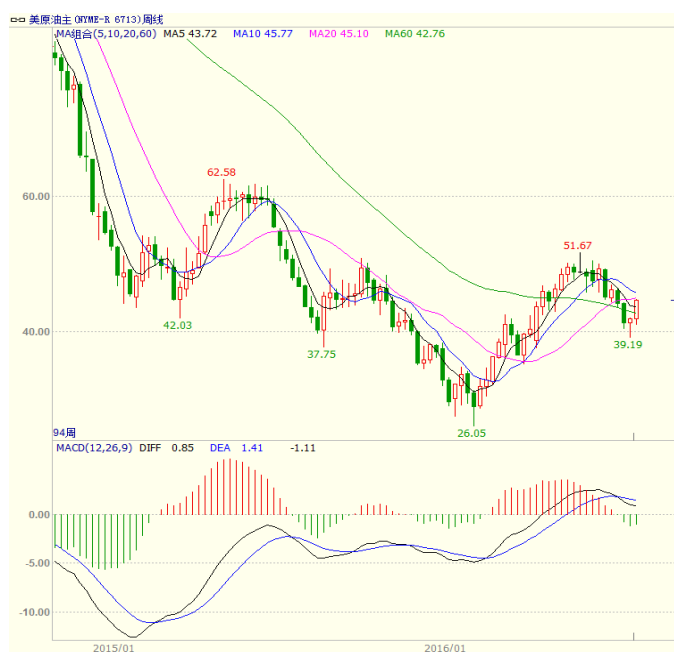
图1 美原油主力合约周线图

本周美国能源信息署(EIA)公布的数据显示,截至8月5日当周,美国EIA原油库存意外增加105.5万桶,预期减少134万桶,前值增加141.30万桶,已经连续3周增加;美国汽油库存大减280.7万桶,超预期;备受市场关注的库欣地区原油库存大增116.3万桶。美国油服贝克休斯公布的数据显示,截至2016年8月12日当周美国石油活跃钻井数增加15座至396座,为连续第七周增加,过去11周内,有10周录得增长。至收盘美原油周K线收盘上涨6.46%,收出中阳线,收盘站上5日均线,短线震荡走势。