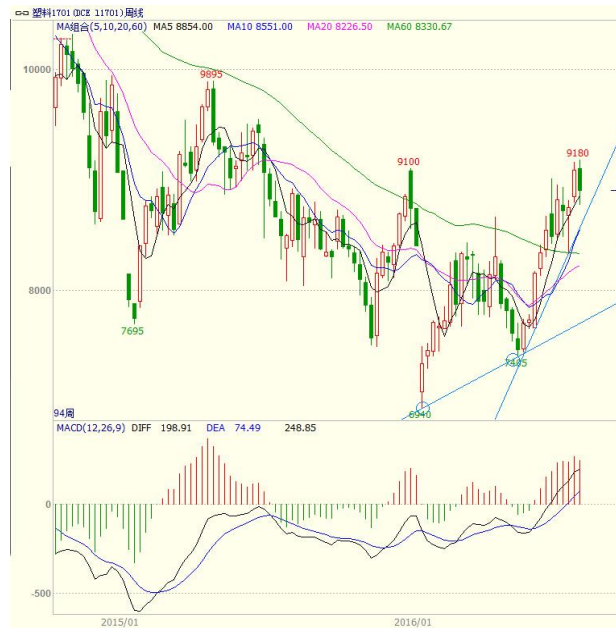
图 4 LLDPE1701 合约周线图