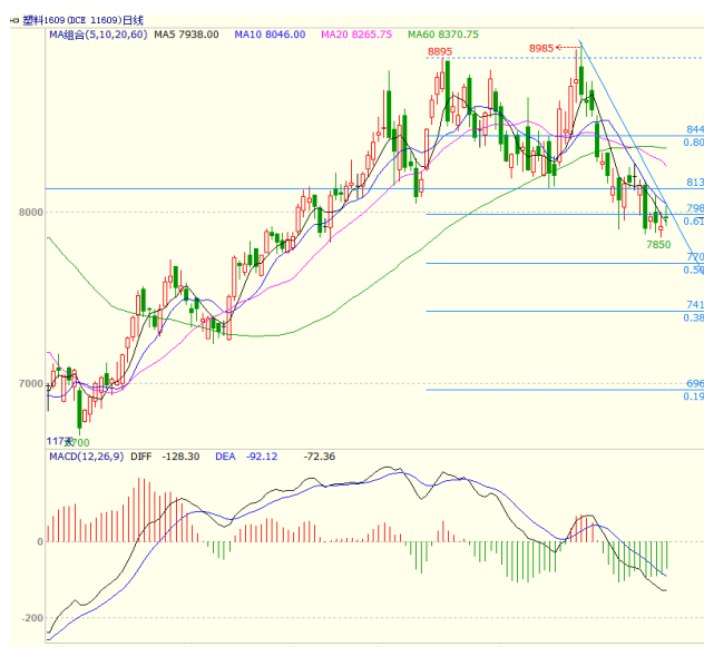
图 3 LLDPE1609 合约日线图

1609 合约本周震荡走低，市场多头做多氛围较弱，空头趋势向下打压，价格震荡走低，不过下方 7850 附近有一定支撑。周一大幅走低收出中阴线、周二高开小幅震荡收出小阳线、周三冲高回落收出带长上影的阴线、周四收出上下影线较长实体较短的小阳线，周五收出十字星，最终周线收出实体较长，上下影线较短的阴线。均线方面，周一大幅走低收在 5 日均线之下，周三虽一度上行至 10 日均线附近，但在此位置承压回落，最终收盘在 5、10 日均线之下，上方 10、20 日均线压力较大。周线上，本周在 20 周均线之下开盘后震荡走低，5、10 周均线继续向下运行，对价格形成压制。