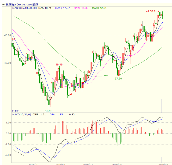
图 1 美原油主力合约价格走势

商业原油库存量 5.4129 亿桶，比前一周增长 131 万桶。备受市场关注的美国俄克拉荷马州库欣地区原油库存 6827.3 万桶，比前周增加了 46.1 万桶。石油服务提供商贝克休斯发布的报告显示，美国本周活跃石油钻井平台数量较上周持平，为 318 座，结束了此前连续下跌的态势，仍维持于 2009 年 10 月以来的最低水平。美原油本周震荡走高，至收盘美原油周 K 线收盘上涨 3.08%，收出带长上影小阳线，短线走势震荡偏强。