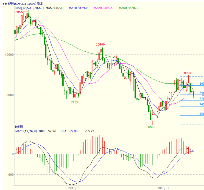
图 4 LLDPE1609 合约周线图