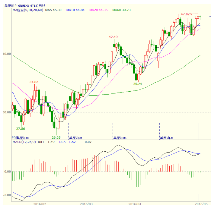
图 1 美原油主力合约价格走势

业原油库存量 5.3998 亿桶，比前一周减少 341 万桶。库存意外出现 3 月以来首次下降，而汽油和馏分油库存降幅均大于预期，并且进口减少，美原油库存数据意外减少对行情形成支撑。石油服务提供商贝克休斯发布的报告显示，美国本周活跃石油钻井平台数量较上周减少 10 座，至 318 座，连续第八周减少，创 2009 年 10 月以来的最低水平。美原油本周震荡走高，至收盘美原油周 K 线收盘上涨 4.06%，收出小阳线，短线走势震荡偏强。