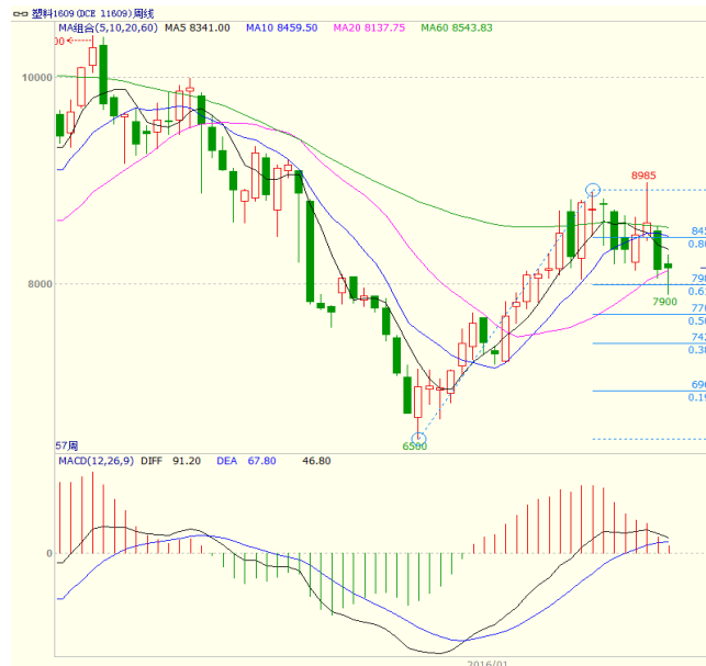
图 4 LLDPE1609 合约周线图