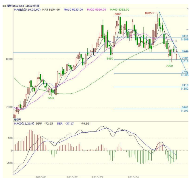
图 3 LLDPE1609 合约日线图

1609 合约本周探低回升，空头虽有向下打压的意愿，但多头在下方承接意愿较强，价格在探低后最终回升，周一收出带长下影阴线、周二低开高走收阳、周三高开低走收阴、周四收出十字星，周五低开高走收阳，最终周线收出下影线较长，阴线实体较短的小阴线。均线方面，周三、周四收盘站在 5 日均线之上，但周五收盘在 5 日均线附近，上方 10、20 日均线压力较大。周线上，本周在 5 周均线之下运行，5、10 周均线继续向下运行，对价格形成压制。