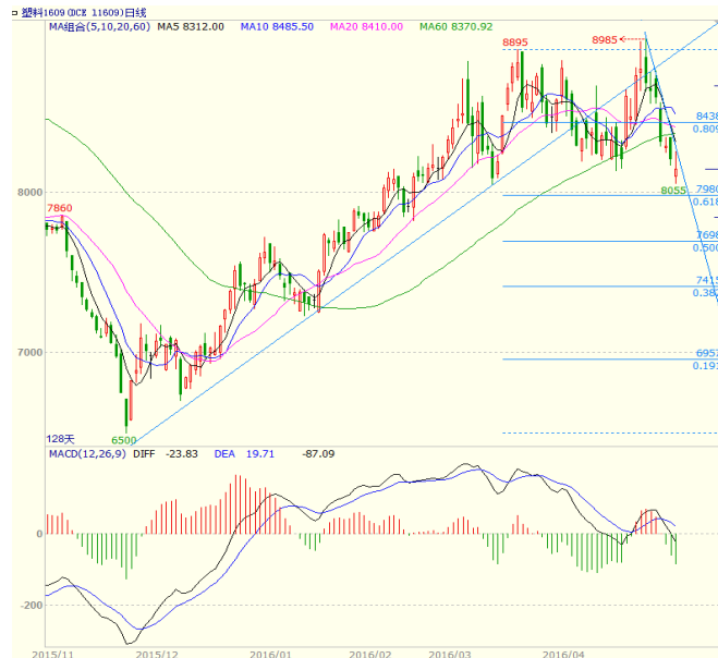
图 3 LLDPE1609 合约日线图

二、周三、周五皆低开，周二、周四收出实体较长阴线，最终周线收出阴线实体较长的中阴线。均线方面，周二跌破 20 日均线支撑，周二至周五运行在 5、10 日均线之下，上方均线对价格形成压制。周线上，本周跌破 5、10 周均线，5 周均线继续向下运行，对价格形成压制。