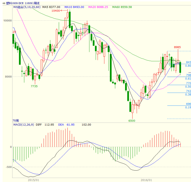
数据来源：文华财经