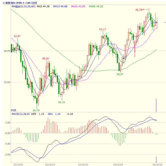
图 1 美原油主力合约价格走势

以来的最低水平。美原油本周震荡走低，至收盘美原油周 K 线收盘下跌 3.13%，收出小阴线，短线走势震荡。