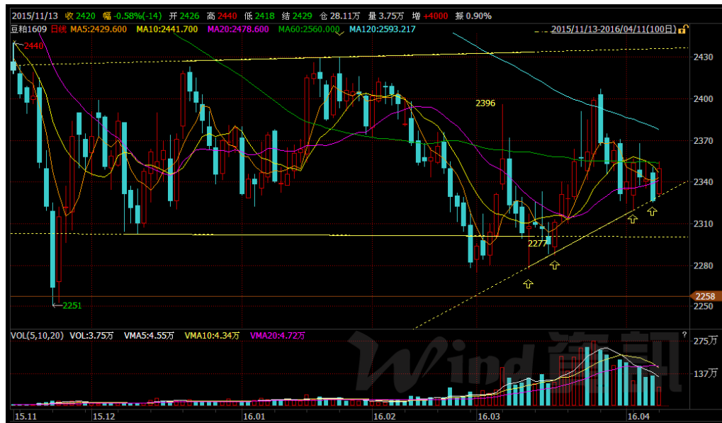
图 3 DCE 豆粕 1609 合约低位震荡图

DCE 豆粕 1609, 价格回踩 2320 至 2330 获得显著支撑, 价格将再度上涨回升至区间上端。(如图 3 示)