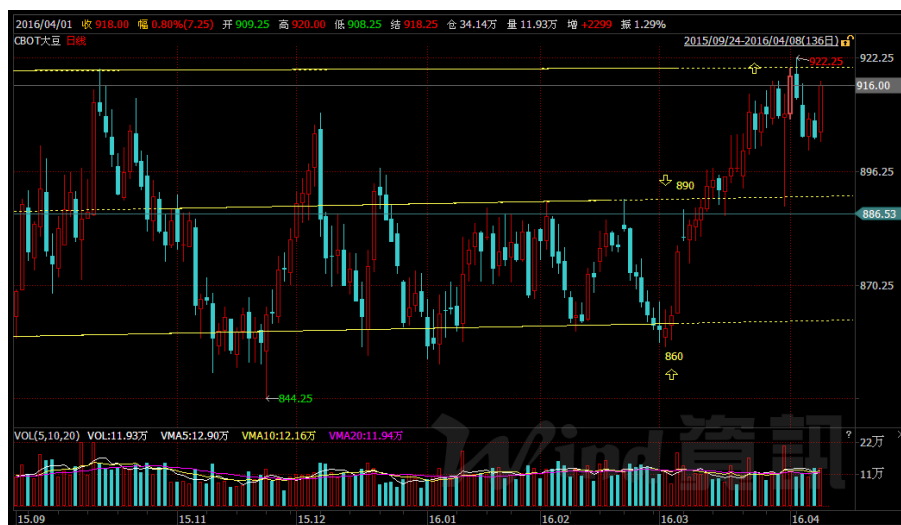
图 1 CBOT 大豆区间波动图

cbot 大豆数月来核心波动区间 844 至 920，缺乏区间突破的动力。（如图 1 示）现突破区间波动中轨，连续五周上涨开阴后，在近半年以来的低位箱体上端（即 900 美分附近）陷入震荡。