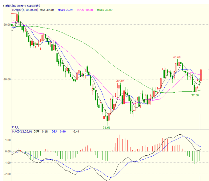
图 1 美原油主力合约价格走势

油库存增加 35.7 万桶，至 6631.8 万桶。石油服务提供商贝克休斯发布的报告显示，美国本周活跃石油钻井平台数量较上周减少 8 座，至 354 座，在过去 16 周内有 15 周出现减少，创 2009 年 11 月 20 日当周以来新低。消息面，石油主产国将于 4 月 17 日在卡塔尔召开会议讨论冻结产量。原油本周探低回升，至收盘美原油周 K 线收盘上涨 8.33%，收出中阳线，显示下方支撑较强。