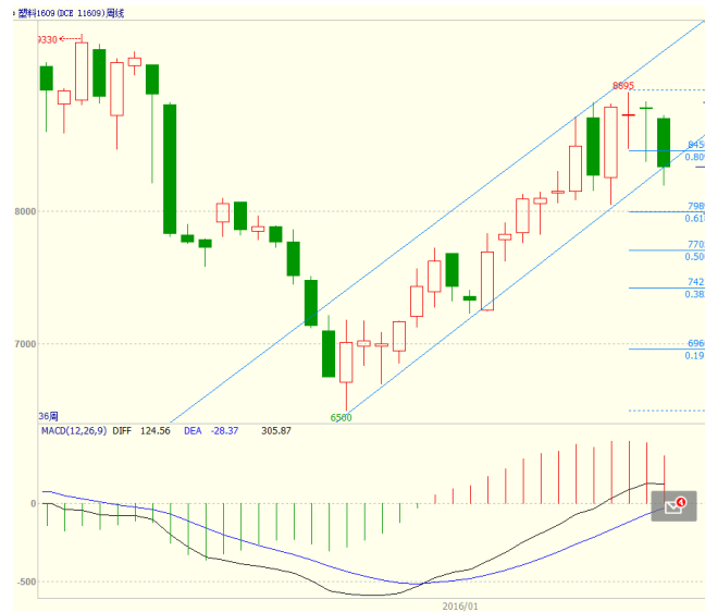
图 4 LLDPE1609 合约周线图