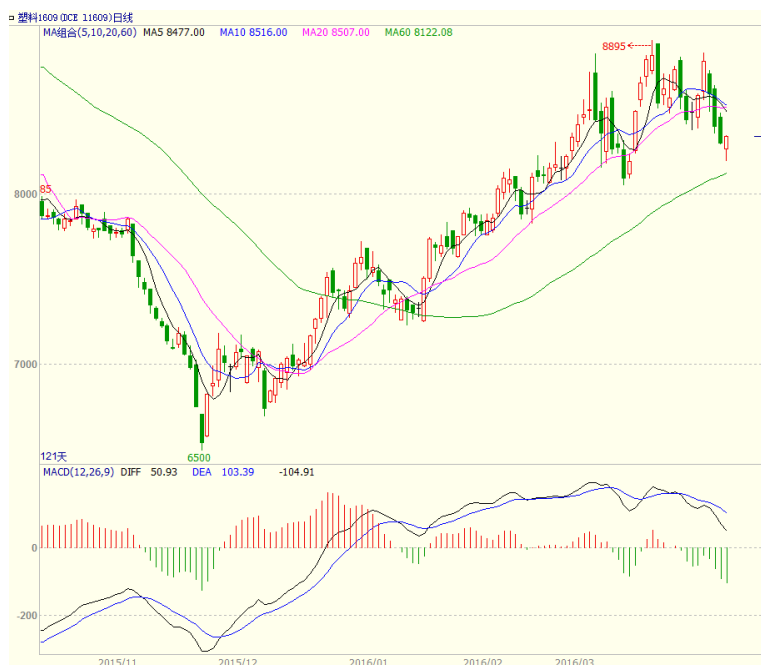
图3 LLDPE1609 合约日线图

日均线对期价有一定支撑。周线5、10、20周期仍多头排列，不过5周均线拐头向下，收盘跌破10周均线支撑。