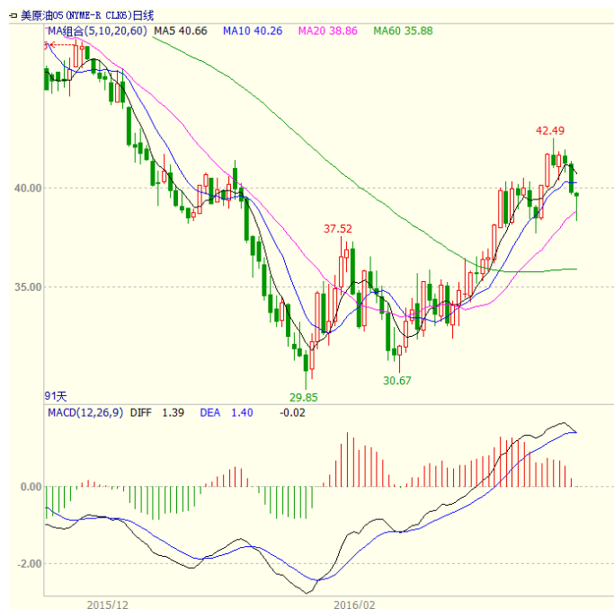
图 1 美原油主力合约价格走势

本周美国能源信息署数据显示，截止 3 月 18 日当周，美国商业原油库存量 5.3254 亿桶，比前一周增长 936 万桶，库欣地区原油库存减少 125.8 万桶，至 6623.8 万桶。石油服务提供商贝克休斯发布的报告显示，美国本周活跃石油钻井平台数量较上周减少 15 座，至 372 座，创 2009 年 11 月 20 日当周以来新低。消息面，石油主产国将于 4 月 17 日在卡塔尔召开会议讨论冻结产量。原油本周震荡走低，至收盘美原油周 K 线收盘下跌 3.74%，收出中阴线，显示上方压力增大。