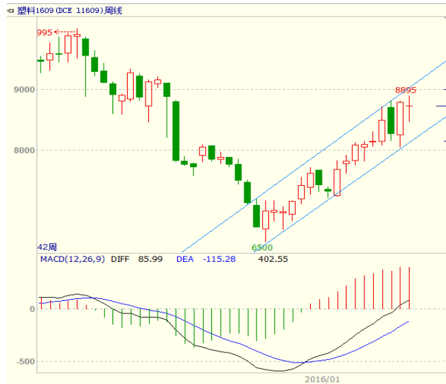
图 4 LLDPE1609 合约周线图