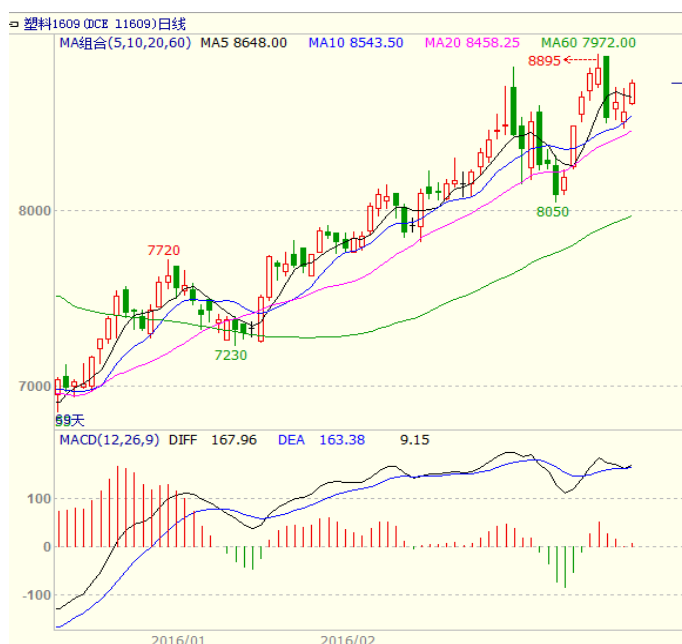
图3 LLDPE1609 合约日线图

日均线处企稳小幅回升，最终周线收出十字星，显示多空力量达到暂时均衡。均线方面，周二走低跌破5日均线支撑，但周四在10日均线获得支撑，而周五重新站上5日均线，下方5、10、20日均线对期价仍有支撑。周线5、10、20周期仍多头排列，支撑力度较强。