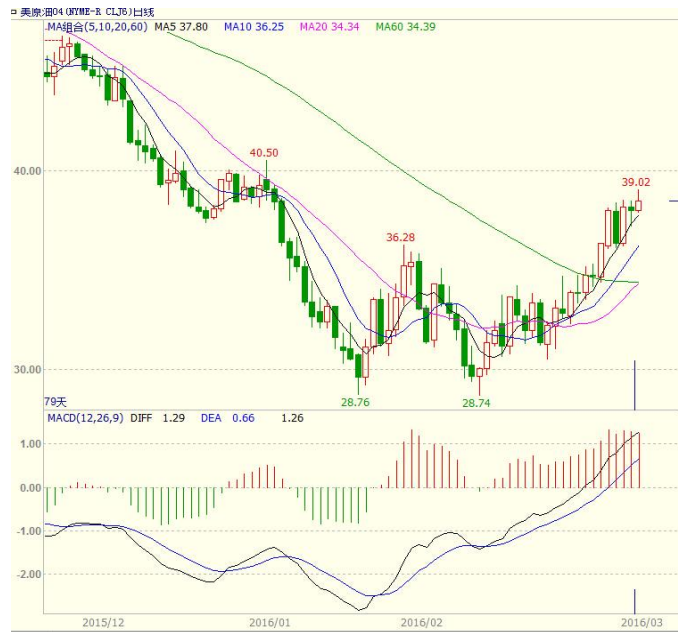
图 1 美原油主力合约价格走势

跃石油钻井平台数量较上周减少 6 座，至 386 座，连续第 12 周减少，较去年同期的 866 座减少一半以上。原油本周震荡走高，至收盘美原油周 K 线收盘上涨 5.95%，收出中阳线，近期油价偏强走势。