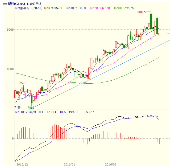
图 3 LLDPE1605 合约日线图

力较大，最终周线以 245 点的阴线报收，阴线实体较长，显示空方力量较强，在前期连续走强后，本周调整幅度较大。塑料本周多空交战激烈，波动幅度增大，阳线及阴线实体较长，周一及周四收出长阴线，周三则收出长阳线。均线方面，5 日均线有拐头向下迹象、周线 5、10、20 周期仍多头排列，关注对行情的支撑力度。