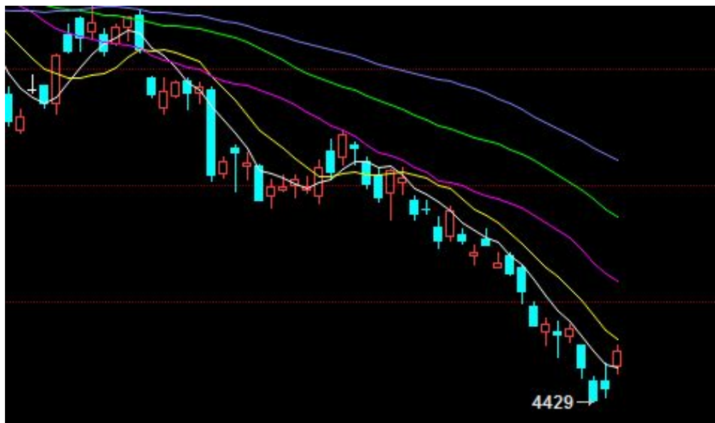
图2 郑糖主力周线图