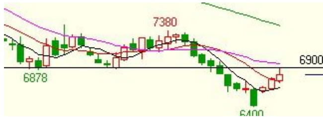
连豆油指数周线图：反弹暂遇阻力

技术说明：持续三周以来的周线级别上涨，暂时遇到颈线阻力，容易陷入震荡和调整，一经突破该颈线压力位，上涨势头将更为强劲，需关注突破。