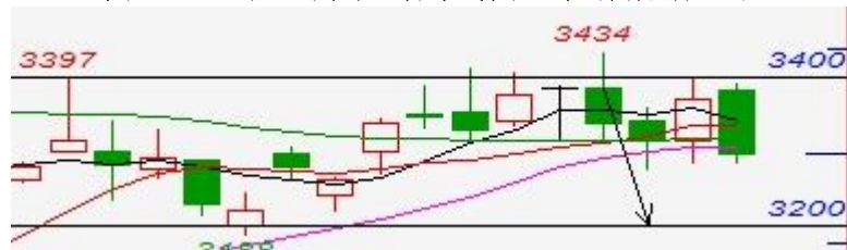
图四、连粕主力合约周线图：箱体震荡趋跌

技术说明：豆油价格指数，深入到了近四年到五年的价格低位区域，是金融危机以来的次低水平。周线级别走出罕见的七周连阴，且在春节之前。一旦再跌落 6600，则技术跌势指向 6350 附近；相反，因长短线的技术条件都属超卖，超跌反弹一触即发。我们建议长期空单宜注意锁定利润离场观望，短线多单适当参与。