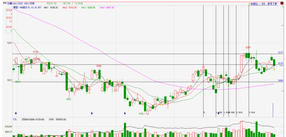
图3 郑糖二次上冲后续乏力