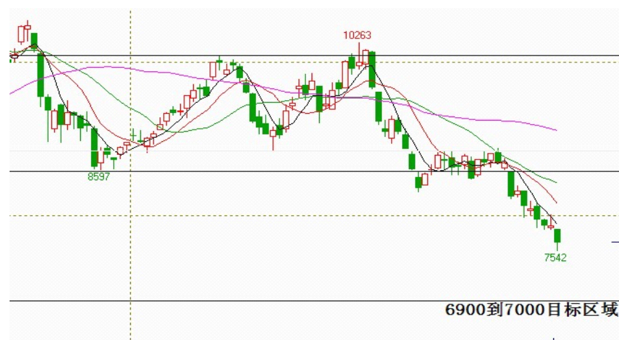
连豆油指数周线寻底未见止跌