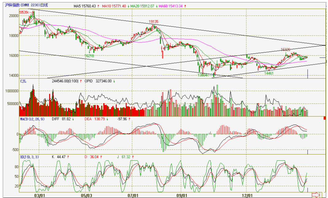
图1 沪锌指数日K线趋势分析

技术上如图1所示本周沪锌指数五个交易日各技术指标走势表现较强，其中本周MACD指标快线慢线跌势企稳，绿色能量柱逐步缩减，KDJ指标三线走势反转向上，并形成低位“金叉”。从日K线上来看，期价反弹后高位震荡，表现出加速回调走势。从持仓量和成交量来看，本周五个交易日持仓量和成交量变动与期价变动配合较好，期价上涨时放量，期价震荡时减量，呈现出强势动向。