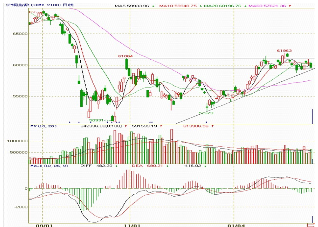
图二：沪铜指数日K线图

图二中两条横线表示沪铜期价高位震荡区间，上面的黑色横线同时也代表前期颈线 61000 一线，本周期价窄幅震荡，依然运行于震荡区间内；MACD 指标中走出“死叉”，绿色能量柱小幅减少，仓位有小幅增加；向右上方倾斜的斜线代表上升趋势线，支撑期价，短期内期价延续区间震荡的可能性大。