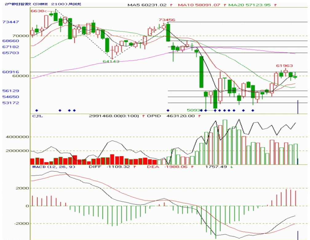
图三：沪铜指数周K线图

图三中右边黑色横线的大势线划出的期价的压力支撑线，黑色横线为上方颈线压力线；前期颈线压力线与大势线一条压力线重合，压制期价；本周期价收于十字星线，较之前一周成交量和持仓量均小幅增加，短期内期价或将延续震荡。