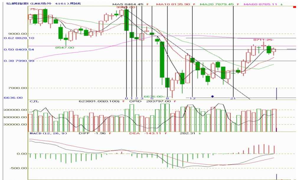
图一：伦铜指数周K线图

图二中两条横线表示沪铜期价高位震荡区间，上面的黑色横线同时也代表前期颈线 61000 一线，本周期价窄幅震荡，依然运行于震荡区间内；MACD 指标中走出“死叉”，绿色能量柱小幅减少，仓位有小幅增加；向右上方倾斜的斜线代表上升趋势线，支撑期价，短期内期价延续区间震荡的可能性大。